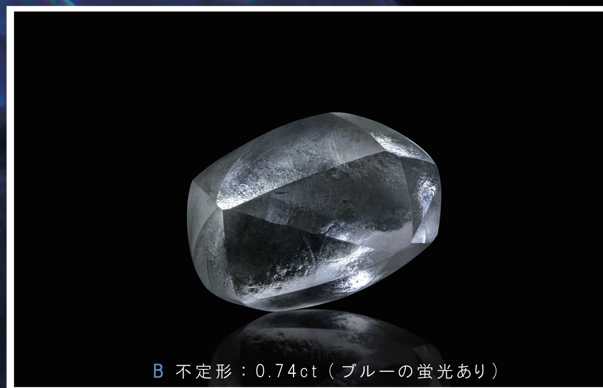
B 不定形：0.74ct(ブルーの蛍光あり)